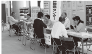
健康相談コーナー